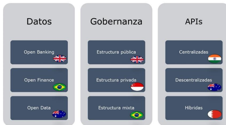
Figura N°2: Modelos internacionales de implementación

A continuación, se presenta una figura que sintetiza algunas características de modelos internacionales según: nivel de datos abiertos diferenciado por el nivel de apertura de datos; estructuras de gobernanza, ya sean públicas, privados o mixtos; formas de gestionar marcos de confianza de los participantes, ya sea con certificaciones o directorios; y diferentes maneras de implementar APIs, desde aquellas más centralizadas, hasta las que son totalmente descentralizadas.