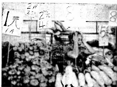
ALIMENTOS AL ALZA. —La inflación subió en marzo principalmente debido al crecimiento de 7,5% en el valor de los alimentos.

Esta semana será importante para el gigante asiático, pues se darán a conocer cifras de comercio y el PIB del primer trimestre, lo que darían nuevas