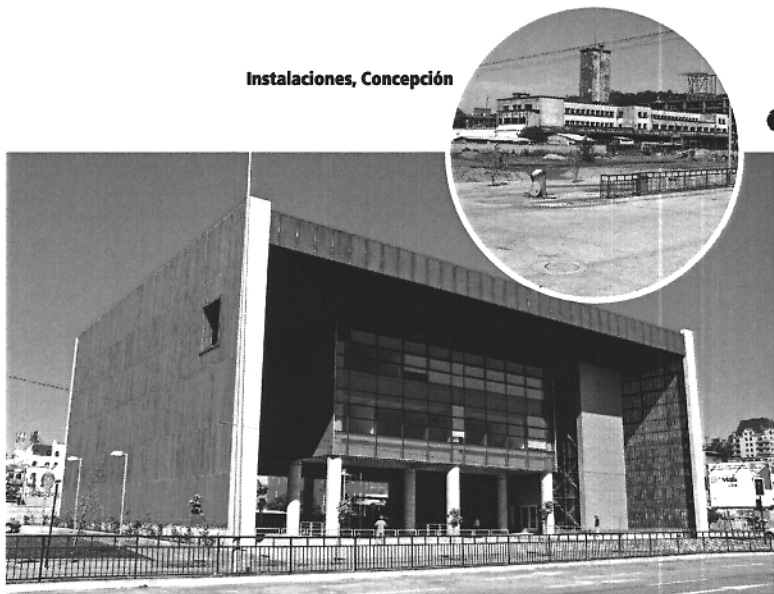
Centro de Gestión de Tránsito, Concepción Actualmente