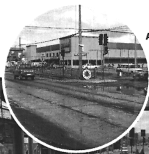
Avenida Manuel Rodríguez