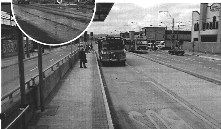
Avenida Manuel Rodríguez Actualmente