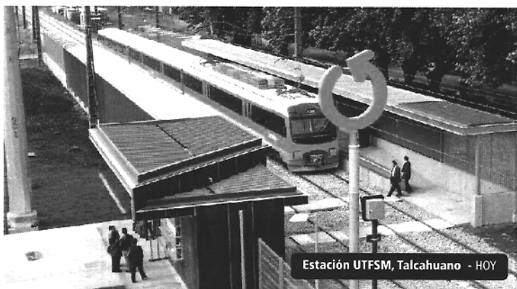
Estación UTFSM, Talcahuano - HOY

En éstas funcionarán los buses alimentadores, para una operación en forma coordinada con los trenes, y que permitirán el traslado de los pasajeros desde las estaciones ferroviarias al centro de las comunas y viceversa.