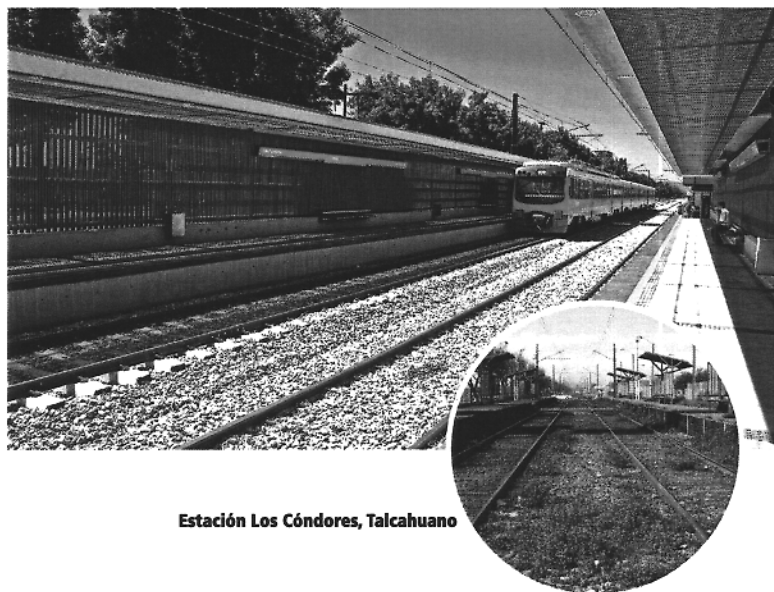
Estación Los Cóndores, Talcahuano