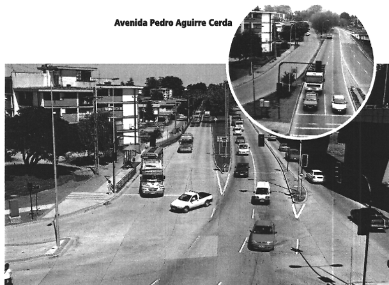
Avenida Pedro Aguirre Cerda