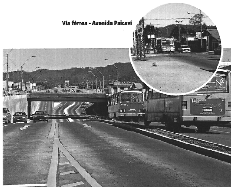
Vía férrea - Avenida Paicavi Actualmente