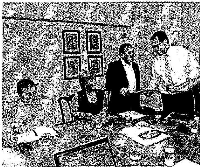
► Una hora y media duró la reunión de ayer en el ministerio.

► Ayer, los docentes se reunieron con el ministro de Educación y se estableció una mesa de trabajo.