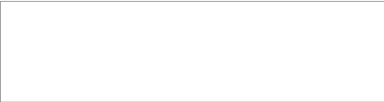
Gráfico N° 2 Evolución del Capital del Sistema Financiero (valores en miles de millones de pesos de junio de 1998)

* Tasas de crecimiento respecto a diciembre de cada año.